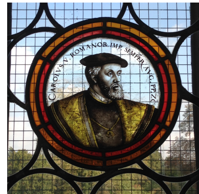
Kaiser Karl V. Bild DEidG | Vergrößern

Fassung vom 16.02.2024 Nach neuerer Fassung suchen