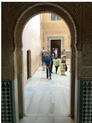
Alhambra: Durchgang zum Patio del Mexuar Hufeisenbögen sind typisch