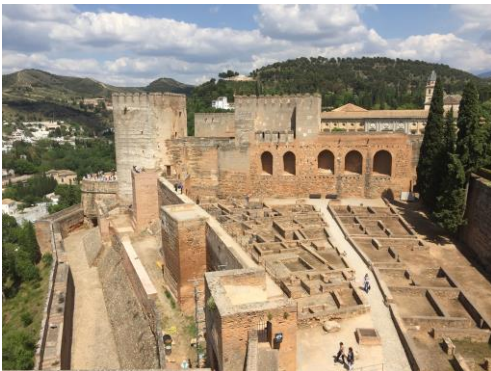
Ältester Teil der Alhambra: Die Festung Alcazaba