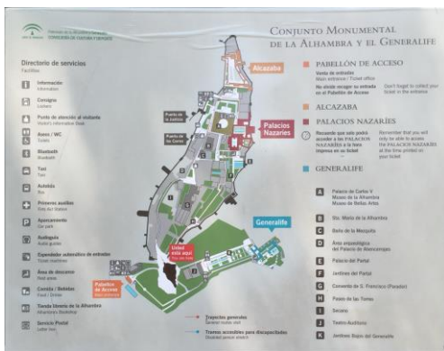
Übersichtsplan über Alhambra und Generalife

Bild gemeinfrei nach § 59 des deutschen Urheberrechtsgesetzes | Vergrößern