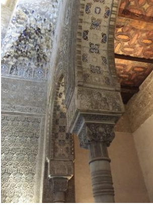
Alhambra: Immer wieder filigraner Dekor