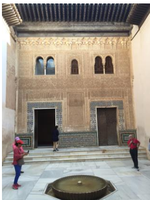
Alhambra: Patio del Mexuar