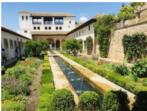
Generalife: Patio de la Acequia