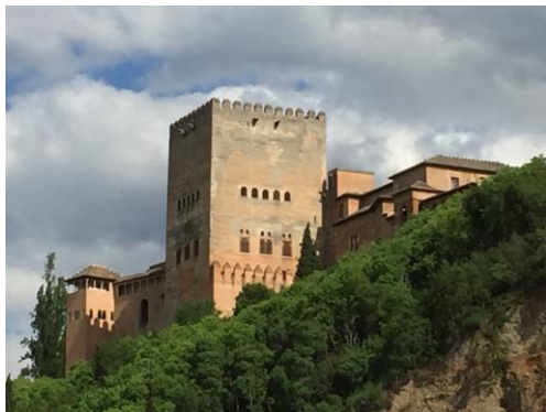
Blick auf die Alhambra, vom Stadtteil Albaicín aus gesehen