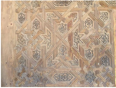
Alhambra: Nasridenpalast, Ornament