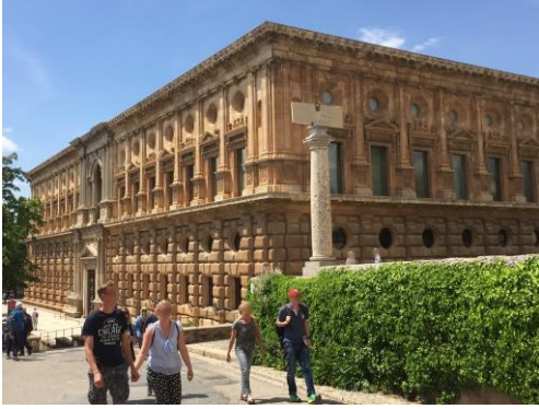
Alhambra: Palast Kaiser Karls V., ein Renaissance- Klotz, der in das filigrane Gefüge der Alhambra nicht hineinpasst.