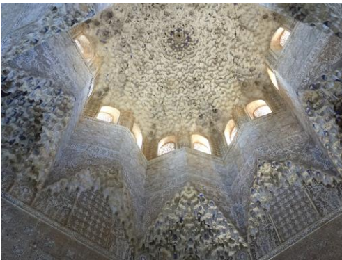
Alhambra: Sternengewölbe in der Sala de los Abencerrajes