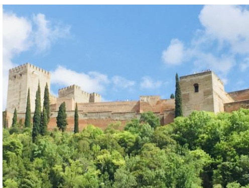
Blick auf die Alhambra, vom Stadtteil Albaicín aus gesehen

Bild gemeinfrei nach § 59 des deutschen Urheberrechtsgesetzes | Vergrößern