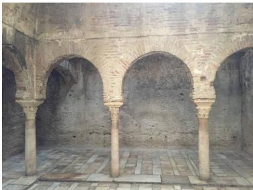
Altstadtviertel Albaicín: El Bañuelo Maurische Bäder des 11. Jahrhunderts