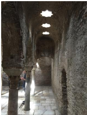
Altstadtviertel Albaicín: El Bañuelo Durch die sternförmigen Öffnungen in der Decke fällt Licht.