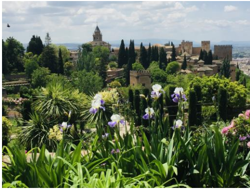
Generalife: Blick auf die Alhambra