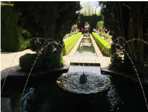
Gärten des Generalife