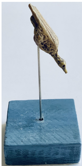
Bild 3: Wasservogel aus dem Hohle Fels bei Schelklingen (Replikat)

Zu sehen im MUT Tübingen (Museum der Universität Tübingen im Schloss)