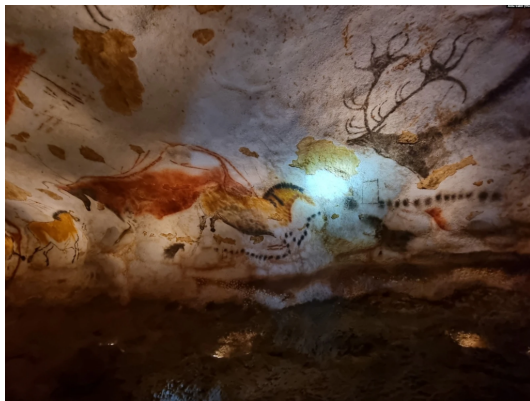
Bild 8: Malerei aus der Höhle von Lascaux (Montignac, Dordogne, France)

Vergrößern