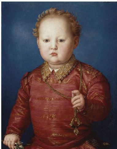
Agnolo Bronzino: Don Garcia de Medici, dritter Sohn von Cosimo I. und Eleonore von Toledo, im Alter von 3 Jahren, ca. 1550 Öl auf Holz Museo del Prado, Madrid Vergrößern