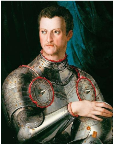
Agnolo Bronzino: Porträt Cosimo I. de' Medici in Rüstung 1545 Öl auf Holz Nationalmuseum Posen Bild gemeinfrei Vergrößern