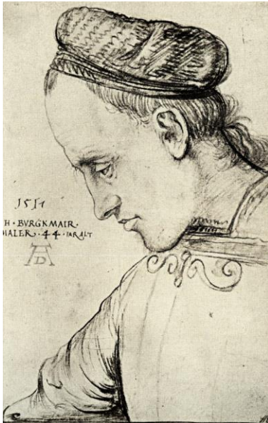
Hans Burgkmair der Ältere: Selbstbildnis (1517)

Das Monogramm Albrecht Dürers ist später hinzugefügt worden.