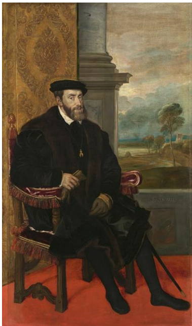
Lambert Sustris, früher Tizian zugeschrieben: