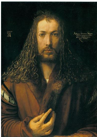
Albrecht Dürer: Selbstbildnis im Pelzrock, 1500 Öl auf Holz Alte Pinakothek, München Bild gemeinfrei Vergrößern

Hier findet man fast alles vor dem 20. Jahrhundert! Einfaches Englisch. Die hier vorgestellten Maler haben noch viel mehr gemacht!