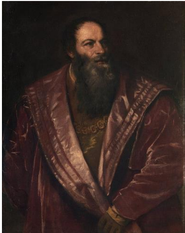
Tizian: Pietro Aretino etwa 1545 Öl auf Leinwand Palazzo Pitti, Galleria Palatina, Florenz Bild gemeinfrei Vergrößern