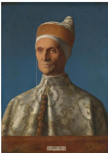
Giovanni Bellini: Porträt des Dogen Leonardo Loredan Um 1501 - 1502 Öl auf Leinwand National Gallery, London Bild gemeinfrei Vergrößern

Fassung vom 17.02.2024 | Nach aktuellerer Fassung suchen