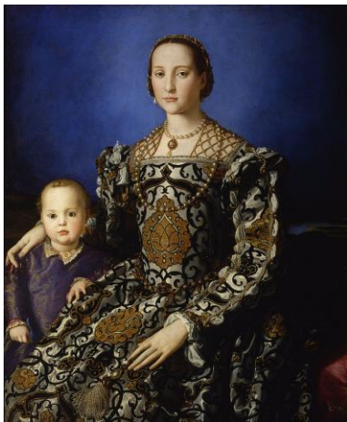
Agnolo Bronzino: Eleonora von Toledo und ihr Sohn Giovanni, 1545 Öl auf Holz Uffizien, Florenz Vergrößern