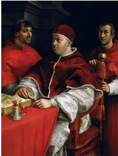
Raffael: Porträt Papst Leos X. und seiner Neffen, den Kardinälen Giulio de' Medici (links) und Luigi de' Rossi (rechts), 1518 Öl auf Holz Uffizien, Florenz Vergrößern