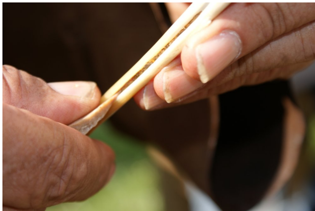
Nadelherstellung Schritt 1