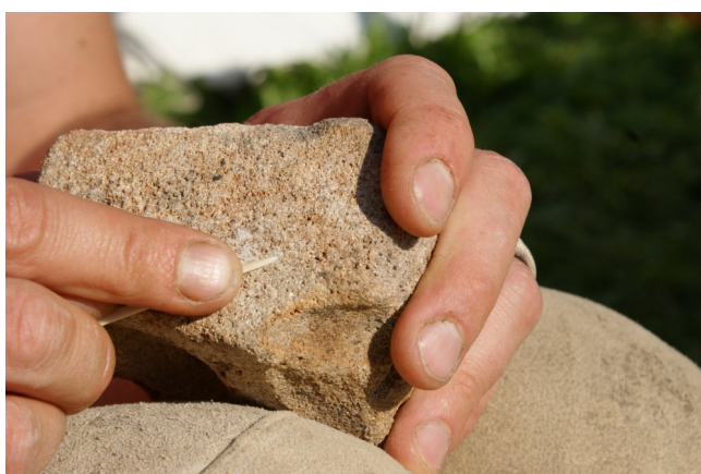
Nadelherstellung Schritt 2