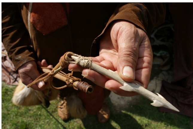
Harpune mit abgenommener Spitze