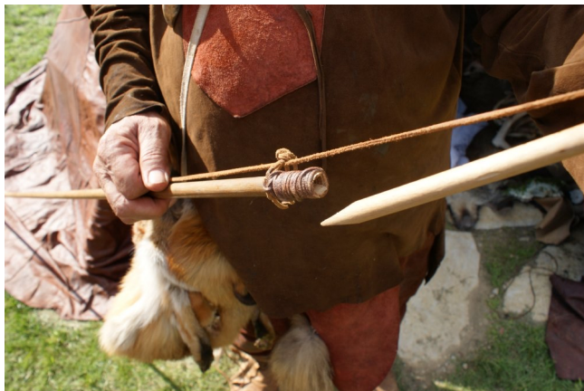
Harpune mit abgenommenem Mittelstück