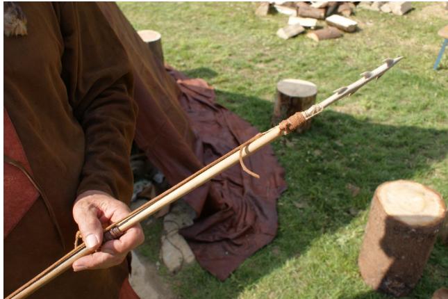
Harpune mit aufgesetzter Spitze