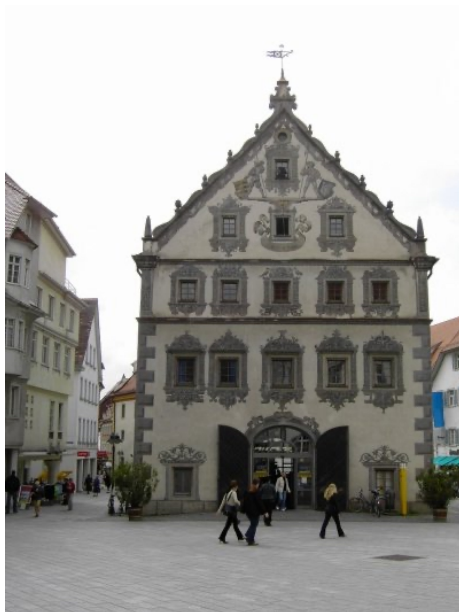
Lederhaus am Marienplatz gegenüber dem Rathaus

Das rote Haus "Brotlaube" liegt in der Marktstraße, in der noch heute der Wochenmarkt abgehalten wird, in der Nähe des Rathauses. Unter den beiden Bögen boten und bieten damals wie heute Bäcker und Metzger ihre Waren an. Im Obergeschoss verkauften Kürschner ihre Produkte.