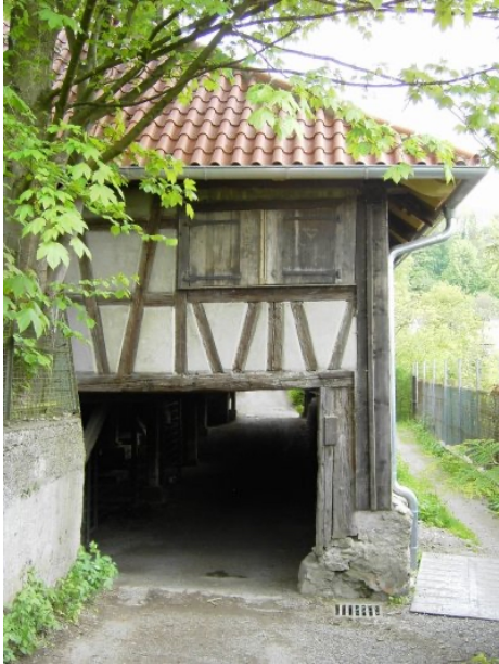
Burghaldentorkel in Ravensburg