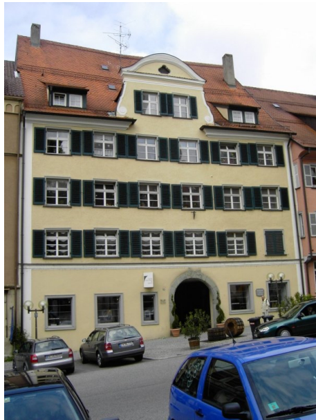
Haus der Ravensburger Handelsgesellschaft am Obertorplatz in Ravensburg (alter Marktplatz)