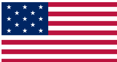
Flagge nach der Unabhängigkeit: 13 Sterne und 13 Streifen stehen für die 13 Gründerstaaten Keine Vergrößerung