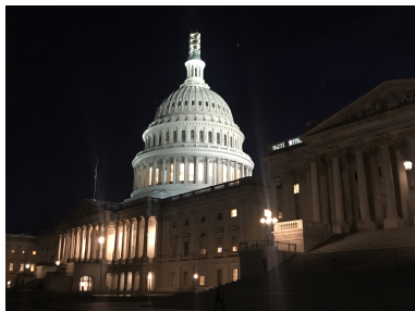
Kapitol in Washington, Sitz des Kongresses Bild DEidG Vergrößern

USA: Die Unionsverfassung Vertiefendes Material