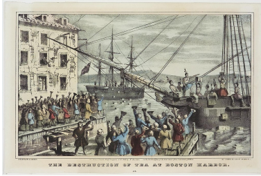
Boston Tea Party 16.12.1776 Vergrößern

Die Feindseligkeiten zwischen den Bostonern und den britischen Truppen erreichten nun mit dem sogenannten Boston“massaker“ im März 1770 einen neuen Höhepunkt: Als britische Soldaten in ein demonstrierende, aggressive Menge feuerten und fünf Demonstranten töteten und sechs verletzten, kochte der Zorn auf die Kolonialmacht hoch.