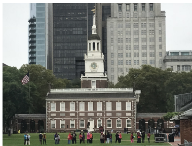
Independence Hall in Philadelphia Hier wurde 1776 die Unabhängigkeitserklärung und 1787 die Verfassung der Vereinigten Staaten unterzeichnet. Vergrößern

Mit der Boston Tea Party am 16.12.1773 eskalierte der Konflikt weiter. Als Indianer verkleidete Kolonisten warfen im Hafen von Boston als Zeichen ihres Widerstandes gegen die britische Teesteuer 342 Kisten Tee von Schiffen der britischen East India Company ins Meer. Nach der nun folgenden Schließung des Hafens von Boston, der Besetzung der Stadt durch englische Soldaten und der Aufhebung der Selbstverwaltung von Massachusetts durch Einsetzung von Thomas Gage als Gouverneur von Massachusetts (Coercive Acts = Zwangsgesetze aus britischer Sicht, Intolerable Acts = nicht hinnehmbare Gesetze aus amerikanischer Sicht) wurde im September 1774 der erste Kongress der 13 Kolonien und Kanadas, auf Einladung der Assembly von Virginia einberufen, um über das gemeinsame Vorgehen gegen Großbritannien zu beraten.