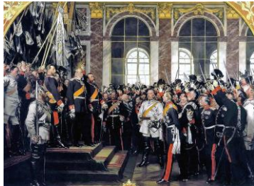
Anton von Werner: Kaiserproklamation im Spiegelsaal von Versailles Bild gemeinfrei Vergrößerung

Der Kaiser steht auf dem Podest, In weißer Uniform Bismarck, neben diesem im Vordergrund im Profil Helmuth von Moltke, Chef des Generalstabs