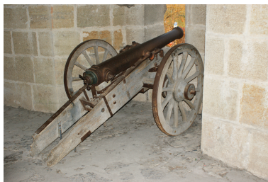
Kanone auf Lafette Bild DEidG Vergrößern

Servet, (Miguel Serveto), spanischer Arzt und Theologe, entdeckte den Blutkreislauf.