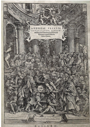
Titelseite der Erstaussgabe von Vesalius' "De humani corporis fabrica" mit Anatomievorlesung Bild gemeinfrei | Vergrößern