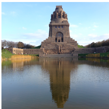
Völkerschlachtdenkmal in Leipzig Bild DEidG Vergrößerung

Kirchenreform durchgezogen und vor allem Tiroler Soldaten in die bayerische Armee eingezogen wurden. Der nun folgende Aufstand unter Andreas Hofer im Jahr 1809 sollte von napoleonischen Truppen niedergeschlagen werden, aber es gelang den Tirolern am Berg Isel, diese dreimal zu besiegen, Jedoch in der vierten Schlacht unterlagen sie, und Andreas Hofer wurde 1809 ergriffen und 1810 in Mantua erschossen.