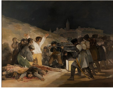
Francisco de Goya Die Erschießung der Aufständischen Bild gemeinfrei Vergrößerung