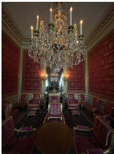
Abdankungssaal in Schloss Fontainebleau Heute Teil des Musée Napoléon Ier. Hier unterschrieb Napoleon am 6. April 1814 seine Abdankungsurkunde, bevor er sich von seinen Truppen auf der Freitreppe des Eingangshofs des Schlosses verabschiedete. Vergrößerung

In den Befreiungskriegen erhoben sich die Deutschen als Nation, die sich in der Abgrenzung gegen den französischen Imperialismus unter Napoleon ihrer selbst bewusst geworden war. So wie die Franzosen Vercingetorix, der Cäsar Widerstand geleistet hatte, als Freiheitshelden feierten, feierten nun die Deutschen Armin den Cherusker als deutschen Freiheitshelden, der die Römer aus den Gebieten östlich des Rheins vertrieben hatte, als Symbol des nationalen Widerstands.