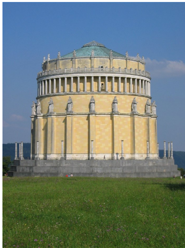
Befreiungshalle in Kelheim Errichtet von König Ludwig I. von Bayern Bild DEidG Vergrößerung