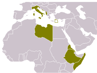
Italien 1940 mit Kolonien Karte gemeinfrei Keine Vergrößerung

Im Januar 1935 kam es zu einer französisch-italienischen Verständigung.