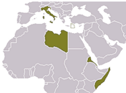
Karte Italien nach dem Ersten Weltkrieg mit Kolonien Karte bearbeitet, gemeinfrei Keine Vergrößerung

Mussolini "trachtete nach `Größe` für sich und Italien, ihm lag daran, bedeutend zu sein, konsultiert, hofiert und, wenn möglich, gefürchtet zu werden." (Parker, 254)