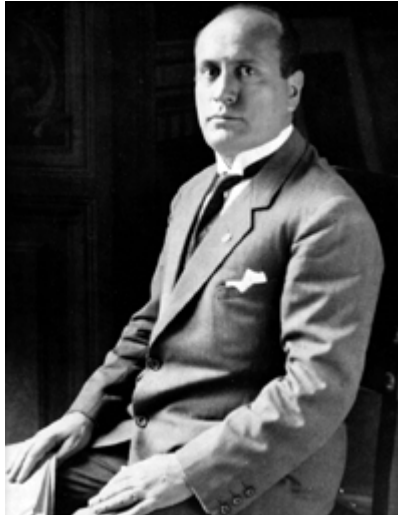
Benito Mussolini um 1925 Bild gemeinfrei Keine Vergrößerung

Italien - Aufbau und Ausbau des faschistischen Regimes - Der Marsch auf Rom Oktober 1922 Vertiefendes Material