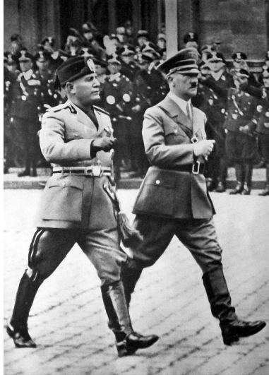
Mussolini und Hitler 1937 in Berlin