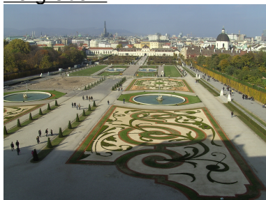
Blick vom Oberen auf das Untere Belvedere, heute Museum Bild: DEidG Vergrößern

TIEFER EINSTEIGEN: Islam von Mohammed bis 1268 Epochenseite