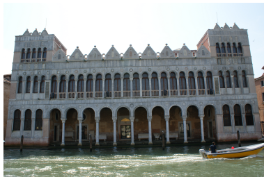
Fontego dei Turchi am Canal Grande in Venedig 1621 an osmanische Händler verpachtet. Vergrößern

"Der osmanische Staat kannte nur das fiskalpolitische (steuerpolitische) Konzept der Abschöpfung, nicht aber die Förderung von Handel und Handwerk. So wurden etwa keine Schutzzölle und Einfuhrbeschränkungen zum Schutz der Produktion im eigenen Land verfügt, von den noch weiter entwickelten wirtschaftspolitischen Instrumenten wie Investitionsanreizen und Exportprämien ganz zu schweigen. Im Gegenteil, aufgrund der Kapitulationen, die - ursprünglich ein Instrument zur Belebung des Außenhandels - im Laufe der Zeit zu einer schweren Belastung für die osmanische Wirtschaft geworden waren, genossen die europäischen Kaufleute im osmanischen Gebiet weitgehende Privilegien. Sie hatten Wettbewerbsvorteile gegenüber ihren osmanischen Konkurrenten, die zudem noch den restriktiven Zunftbestimmungen unterlagen und deren Vermögen - im Gegensatz zu dem der Europäer - jederzeit beschlagnahmt werden konnte.