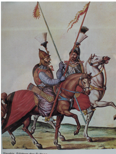
Sipahis, Söldner des Sultans Osmanische Sipahis Vergrößern

Zum staatlichen Grund und Boden zählten die großherrlichen Staatsdomänen (has-i hümayun), aus denen die Hofhaltung des Sultans finanziert wurde. Der Großteil der Ländereien jedoch wurde vom Staat innerhalb eines Systems von Landzuweisungen, dem sog. Timar-System, als Pfründe vergeben." (Quelle: Tuerkenbeute.de)