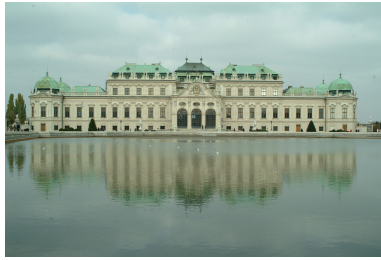
Oberes Belvedere, Wien Schloss des Prinzen Eugen von Savoyen, heute Museum Bild DEidG Vergrößern