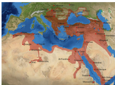
Das Osmanische Reich in seiner größten Ausdehnung um 1600 n.Chr. Karte gemeinfrei Vergrößern

Basisaufgabe: Fasse den Basistext in Stichworten zusammen.