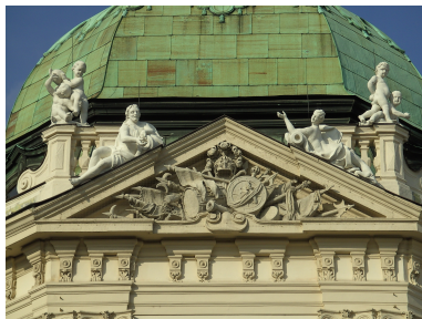
Details des Oberen Belveder erinnern an den Sieg in den Türkenkriegen Vergrößern