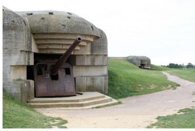
Deutsche Bunker des Atlantikwalls in Longues-sur-Mer Vergrößern