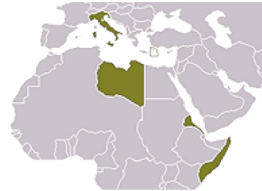
Karte Italien nach dem Ersten Weltkrieg mit Kolonien Karte bearbeitet, gemeinfrei