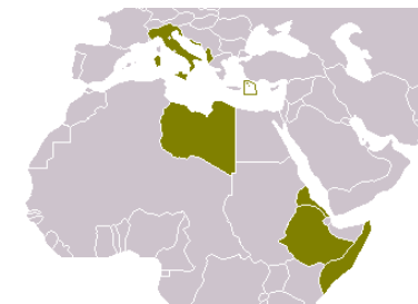
Italien 1940 mit Kolonien Karte gemeinfrei

Hrsg. u. verf. v. R. A. C. Parker: Fischer Weltgeschichte Das Zwanzigste Jahrhundert Europa 1918-1945 Frankfurt am Main, 93. - 95. Tausend August 1983