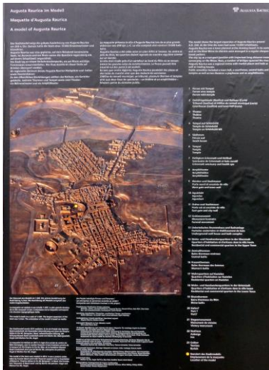
Modell von Augusta Raurica

Bild gemeinfrei nach Art. 27 Schweizer Urheberrechtsgesetz | Vergrößern