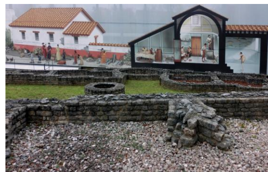
Bild vom Badebetrieb vor 1700 Jahren an der Badeanlage mit Brunnenhaus in der Fellenriedstrasse, im Modell Nr. 9

Basisaufgabe 2: Zeige auf der Infotafel zur Stützmauer das Forum und seine Bestandteile.