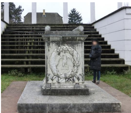
Haupttempel auf dem Forum mit Altar. Der Tempel diente dem Kaiserkult. Vergrößern

Denkaufgabe 2: Beschreibe die Abbildungen auf dem Altar. Welchem Zweck dienten sie wohl?