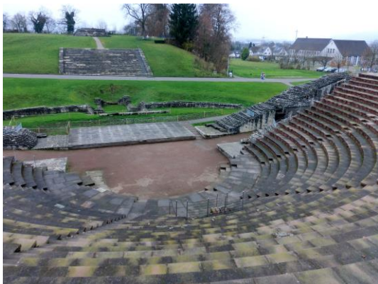
Blick vom Theater auf den Tempel auf dem Schönbühl. Im Modell Nr. 3 und 4 Bild DEidG | Vergrößern

Bild gemeinfrei nach Art. 27 Schweizer Urheberrechtsgesetz | Vergrößern