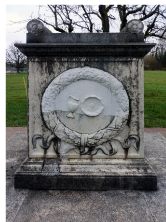
Rückseite des Altars mit abgebildeter Opferschale | Vergrößern