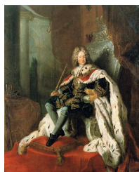
Antoine Pesne, König Friedrich I., Ölgemälde, undatiert, vor 1713 Bild gemeinfrei | Vergrößerung