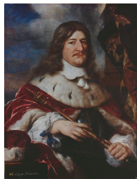
Kurfürst Friedrich Wilhelm I. von Brandenburg, mit Szepter, Harnisch, Kurhut und -mantel Gemälde von Govaert Flinck, um 1652 Bild gemeinfrei | Vergrößerung

Bilder/ Bildunterschriften auf dieser Seite von / nach Wikipedia