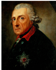
Friedrich II. der Große, Gemälde von Anton Graff, 1781 Bild gemeinfrei | Vergrößerung