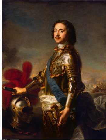
Peter I., Ölgemälde von Jean-Marc Nattier, 1717 Bild gemeinfrei Vergrößerung