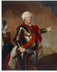
Friedrich Wilhelm I. im Harnisch mit Hermelinmantel, Marschallstab sowie Bruststern und Schulterband des Schwarzen Adlerordens (Gemälde von Antoine Pesne, um 1733) Bild gemeinfrei | Vergrößerung