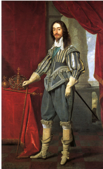
König Karl I. Stuart, Porträt von Daniel Mytens (1631) Bild gemeinfrei Vergrößern

In England kommt es nach Versuchen der Könige Jakob I. Stuart und Karl I. Stuart, den Absolutismus durchzusetzen und Schottland die anglikanische Staatskirche aufzuzwingen, zum Zusammenstoß zwischen König und Parlament (damals Vertretung von Adel und Besitzenden), der sich in einem Bürgerkrieg entlädt. Jakob I. erhob vor dem Hintergrund eines drohenden Staatsbankrotts Zölle auf Importwaren, ohne die Zustimmung des Parlaments einzuholen. Das Unterhaus besteht darauf, "dass die wichtigen und dringenden Angelegenheiten, die den König, den Staat, die Verteidigung des Königreiches und der Kirche von England, die Beobachtung der Gesetze und die Gesetzgebung ... zu den eigentlichen Gegenständen und Angelegenheiten der Beratung und Diskussion im Parlament gehören." (Protestation des Unterhauses von 1621) Auch fordert es Redefreiheit und "Sicherheit vor Anklage, Verhaftung und Behelligung" (ebenda).