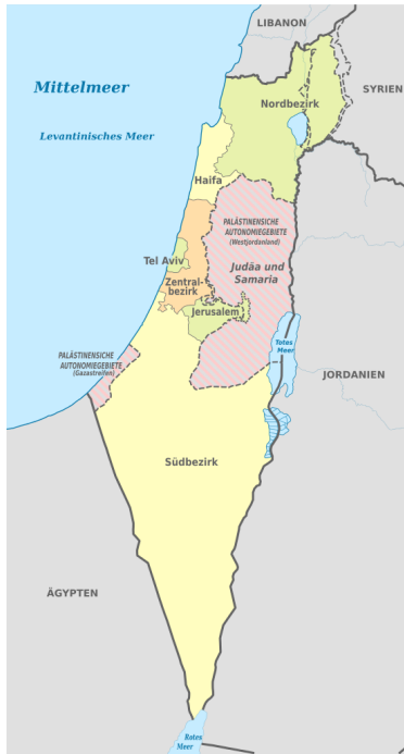
Karte Israels mit Bezirken heute.

Die Grenzen gehen auf den Krieg von 1948/49 zurück. Nach 1948/49 waren Westbank und Ostjerusalem noch jordanisch, der Gazastreifen ägyptisch.