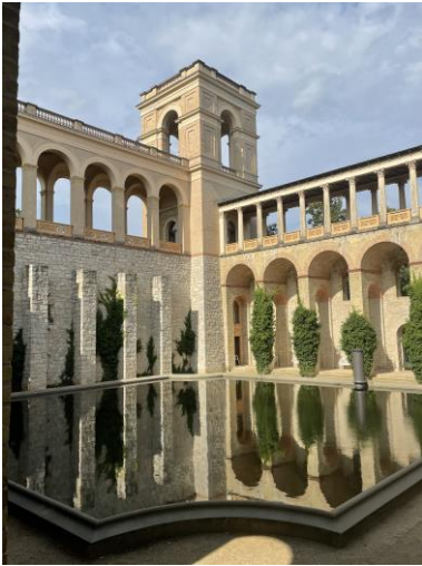
Belvedere, erbaut 1847 - 1863, Blick in den Innenhof mit Wasserreservoir. | Vergrößern