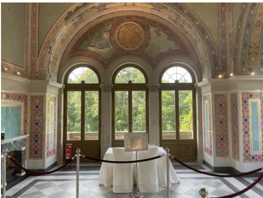
Belvedere, Maurisches Kabinett Bild DEidG | Vergrößern