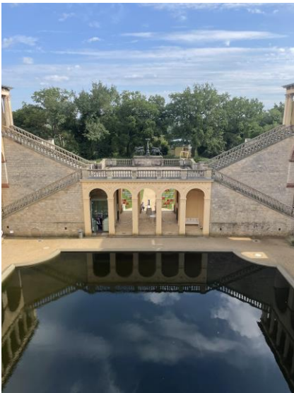
Belvedere , Blick über den Innenhof in die Weite Bild DEidG | Vergrößern