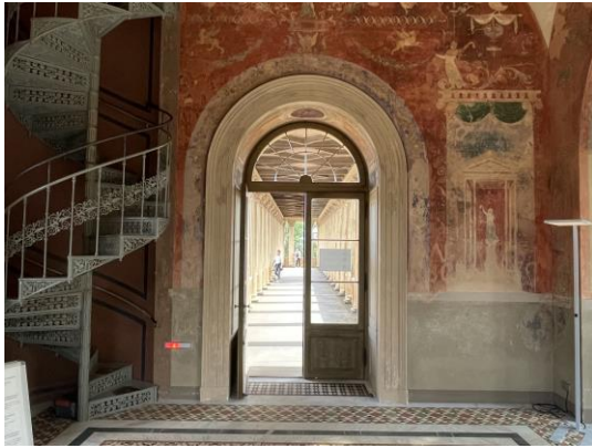
Belvedere, Römischer Kabinett, Wandmalerei im pompejanischen Stil, fragmentarisch. Große Fehlfächen in Rot ergänzt. | Vergrößern