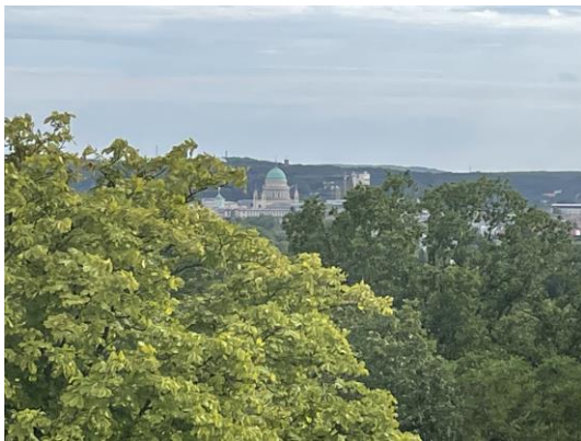
Belvedere, Blick von der obersten Etage mit Sichtachse auf die Potsdamer Nikolaikirche