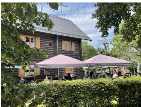
Hier der nebenan befindliche Garten Bild DEidG | Vergrößern

den Kolonisten ein bis heute bestehendes unveräußerliches Recht der Nutznießung ein.