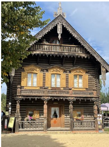
In einem der Häuser kann man einkehren. Hier steht übrigens auch die Infotafel oben. | Vergrößern