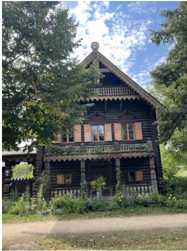
Frontalaufnahme desselben Hauses Bild DEidG | Vergrößern