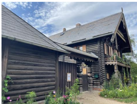
Eines der Häuser der Kolonie Bild DEidG | Vergrößern

Fassung vom 05.10.2024 | Nach aktuellerer Fassung suchen