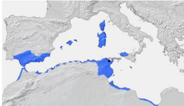
Karte Karthago im 3. Jh. v.Chr.

Rom – das ist zunächst nur die zeitweise von etruskischen Königen beherrschte Stadt am Tiber, die aber im Lauf der Zeit zuerst ihr Umland, dann ganz Italien unterwirft. Mit der Einnahme von Tarent im Jahr 272 v.Chr. beherrscht Rom nun ganz Unteritalien.