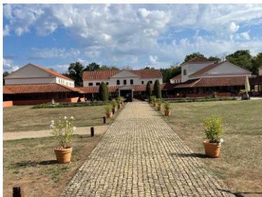
Villa Rustica in Borg, rekonstruierter römischer Gutshof mit repräsentativem stadtartigem Hauptgebäude Bild DEidG Vergrößerung

Links im Bild der Circus Maximus, daneben die Kaiserpaläste auf dem Palatin, dahinter das Kapitol. Rechts das Colosseum, dahinter das Forum Romanum und die Kaiserforen Im Vordergrund die Wasserleitung auf den Palatin