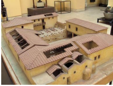
Römisches Landgut, Modell im Museo della Civiltà Romana, Rom

Sklaven arbeiteten auch auf solchen Gütern.