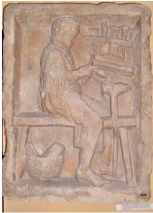
Schuhmacher Relief im Museo della Civiltà Romana, Rom

Handwerker zum Beispiel gehörten zur Plebs