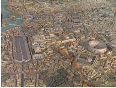
Blick auf das Zentrum Roms in der Antike. Modell im Museo della Civiltà Romana, Rom | Bild DEidG Vergrößerung

Links im Bild der Circus Maximus, daneben die Kaiserpaläste auf dem Palatin, dahinter das Kapitol. Rechts das Colosseum, dahinter das Forum Romanum und die Kaiserforen Im Vordergrund die Wasserleitung auf den Palatin