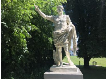
Kaiser Augustus, Kopie seiner Statue von Primaporta in Kempten Vergrößerung