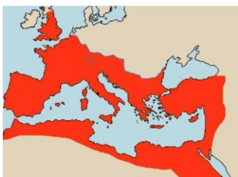
Das Römische Reich in der Kaiserzeit

Rom beherrschte zu diesem Zeitpunkt den größten Teil Italiens, wollte sich aber im westlichen Mittelmeer ausdehnen, zunächst auf Sizilien, Sardinien, Korsika und entlang der Mittelmeerküste Richtung Spanien, was auch gelang.