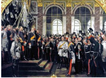
Anton von Werner: Kaiserproklamation im Spiegelsaal von Versailles Bild gemeinfrei Vergrößerung

Der Kaiser steht auf dem Podest, In weißer Uniform Bismarck, neben diesem im Vordergrund im Profil Helmuth von Moltke, Chef des Generalstabs