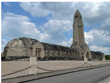
Beinhaus von Verdun