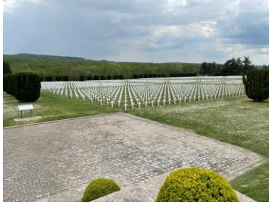
Blick vom Beinhaus von Verdun auf einen Soldatenfriedhof Bild DEidG Vergrößerung

Lebensmitteln und kriegswichtigen Rohstoffen geht das Kaiserreich immer mehr zur zentralen Regulierung der Wirtschaft über.