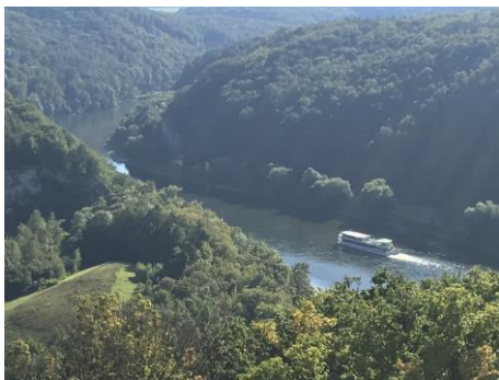
Blick von der äußeren Galerie in den Donaudurchbruch Bild DEidG | Vergrößern