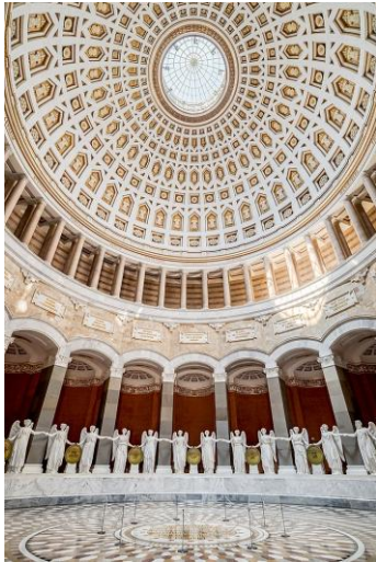
Befreiungshalle, Innenansicht Bild

This file is licensed under the Creative Commons Attribution-Share Alike 4.0 International license . Autor GZagatta