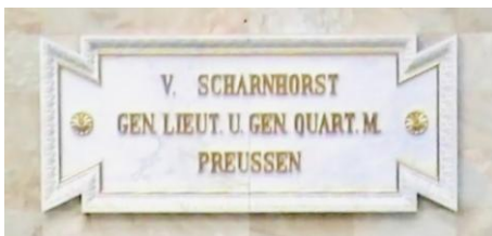
Tafel für Generalleutnant und Generalquartiermeister von Scharnhorst, einem der preußischen Reformer unter König Friedrich Wilhelm III.