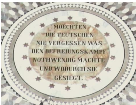
Mahnspruch im Fußboden Bild DEidG | Vergrößern