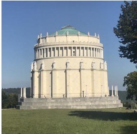
Befreiungshalle, Außenansicht | Vergrößern