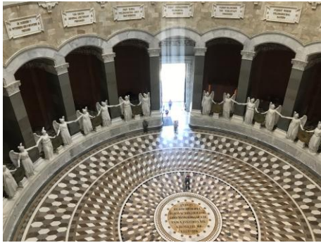
Blick von der Galerie nach unten Richtung Eingang mit Fußboden und Mahnspruch Bild DEidG | Vergrößern