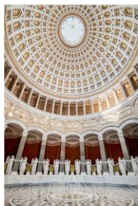
This file is licensed under the Creative Commons Attribution-Share Alike 4.0 International license . Autor Gzagalla Auf Wikipedia, Artikel Befreiungshalle

Kassetierte Kuppel mit Opaion (runde Lichtöffnung im Kuppelscheitel)