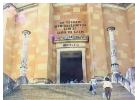
Aufgang zur Befreiungshalle. Über der Tür: Den deutschen Befreiungskämpfern Ludwig I. König von Bayern | Vergrößern

Achtzehneckiger, dreistufiger Sockel mit Kandelabern