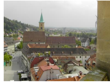
Ehemaliges Karmelitenkloster in Ravensburg

Denkaufgabe 3: Religionsfreiheit und Toleranz: Gegen wen und gegen welche Interessen mussten diese offenbar durchgesetzt werden? Wo konnten die Kräfte der Toleranz anknüpfen?