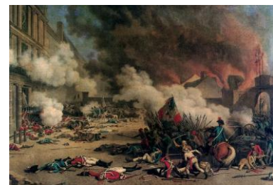
Sturm auf die Tuilerien 10.08.1792

Lila: Staaten im Krieg gegen Frankreich revolution.1789.free.fr