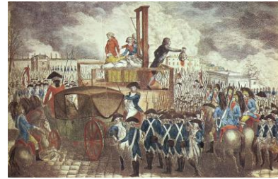
Hinrichtung Ludwigs XVI.

Girondisten und Radikale halten sich zunächst die Waage, wobei letztere aber im Laufe der Entwicklung immer zahlreicher werden. Der König wird noch am 21. September 1792 offiziell abgesetzt, Frankreich ist ab dem 22. September 1792 offiziell Republik . Damit sind die Girondisten und die ganz Radikalen am Ziel ihrer Wünsche. Am 21. Januar 1793 wird der König dann als Hochverräter, der mit dem Ausland zusammenarbeite, enthauptet.