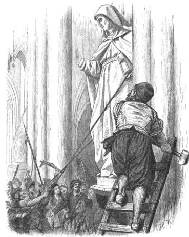
Bildersturm in Holland. Darstellung von 1882 Bild gemeinfrei Vergrößern

Vor allem die Schweiz selbst aber spaltet sich nun konfessionell. Auf der einen Seite stehen die Innerschweizer Kantone, die dem Katholizismus treu bleiben, auf der anderen Seite die Kantone Basel, Bern, Schaffhausen, St. Gallen, Graubünden und Appenzell, die Zwingli anhängen.