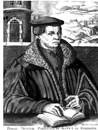
Porträt Thomas Müntzers (1489 - 1525)

Damit trifft er auf den Widerstand der Mächtigen und Reichen seiner Zeit, der Fürsten, des Adels und der Patrizier in den Städten, die dies zu verhindern suchen, und denen er vorwirft, den von ihm befürworteten Widerstand der Armen