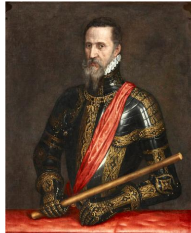
Herzog Alba auf einem Gemälde von Tizian Vergrößern