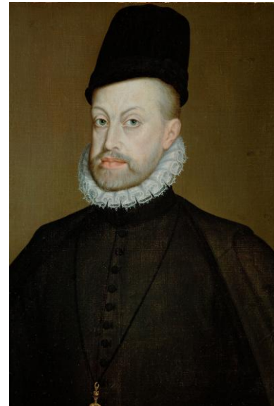
Alonso Sánchez Coello: Philipp II., um 1570 Bild gemeinfrei Vergrößern

Fassung vom 16.11.2025 Nach neuerer Fassung suchen