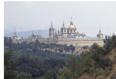
El Escorial Erbaut von Philipp II. außerhalb von Madrid als Kloster sowie Memorial- und Grabbau für seinen Vater Karl V. Seither Grabstätte der spanischen Könige und Königinnen. Philipp II. regierte von hier aus lange Jahre sein Weltreich | Vergrößern