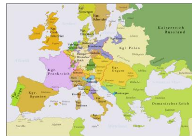
Karte Europas zur Zeit des Siebenjährigen Krieges This file is licensed under the Creative Commons Attribution 3.0 Unported license. Vergrößern

Basisaufgabe: Notiere den Text in Stichworten.