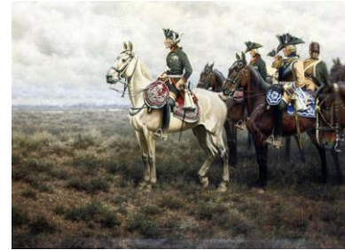
Friedrich der Große mit Offizieren in der Schlacht bei Leuthen in Schlesien, 1757 Gemälde von Hugo Ungewitter 1906 Bild gemeinfrei | Vergrößern

Fassung vom 17.11.2025 Nach neuerer Fassung suchen