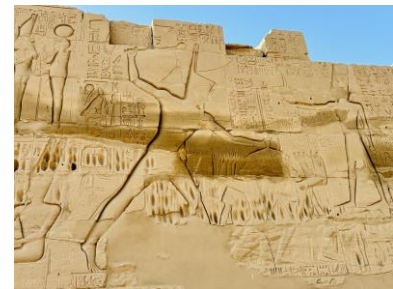
Der König erschlägt seine Feinde (Darstellung am Karnaktempel)