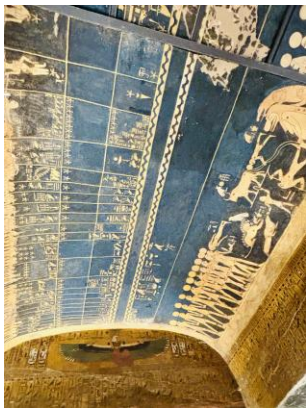
Die Decke der großen Pfeilerhalle