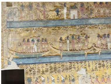
Wand der großen Pfeilerhalle, Detail 2