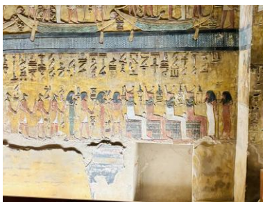
Wand der großen Pfeilerhalle: Detail 1