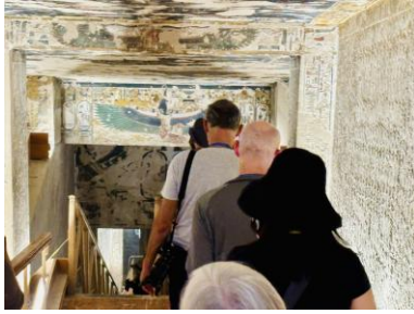
Treppenabgang in das Grab. Über dem Türsturz Maat | Vergrößern