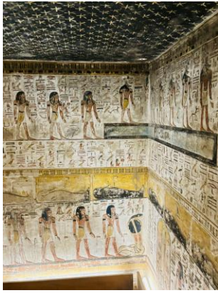
Nebenraum mit Sternenhimmel