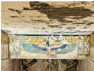
Über dem Türsturz Maat, daneben die Kartuschen von Sethos I. Bild: DEidG | Vergrößern

Du kannst mit Hilfe des Kontaktformulars auf der Startseite Fragen zu den Aufgaben stellen.