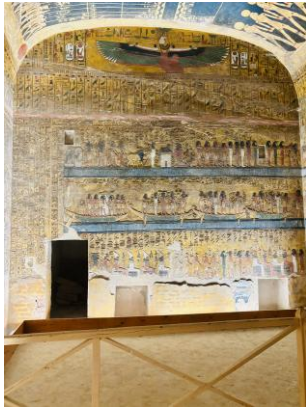
Wand der großen Pfeilerhalle