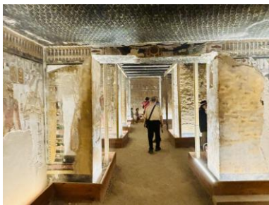
Eine weitere Pfeilerhalle Vergrößern