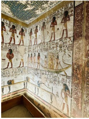
Mit der Barke in die Unterwelt | Vergrößern