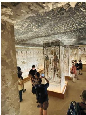
Die erste Halle mit Pfeilern | Vergrößern