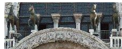
Die Pferde am Dom San Marco in Venedig