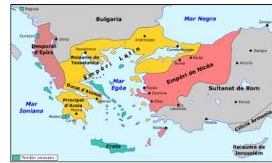
Karte Lateinisches Kaiserreich | Vergrößern

“Nonnen wurden in ihren Klöstern geschändet. Die Plünderer drangen gleichermaßen in Paläste und armselige Hütten ein und schlugen sie in Trümmer. Verletzte Frauen und Kinder lagen sterbend in den Straßen. Drei Tage lang hielt dieses Grauen der Plünderung und des Blutvergießens an. (ebd., S. 899)