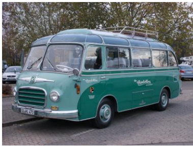
Setra Omnibus Bild KUM-G | Vergrößerung