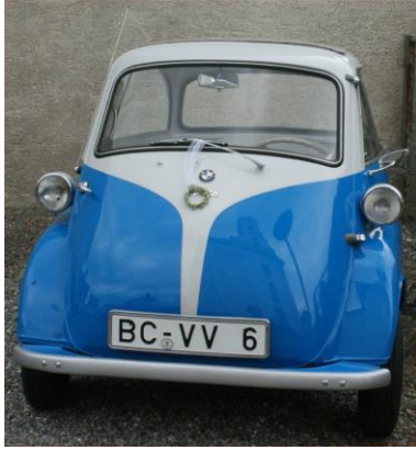
Isetta | Vergrößerung