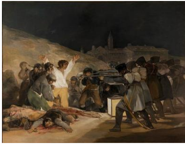
Francisco de Goya Die Erschießung der Aufständischen Vergrößerung