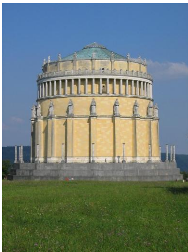
Befreiungshalle in Kelheim Errichtet von König Ludwig I. von Bayern Bild DEidG Vergrößerung