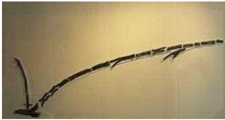
Pflug von Walle bei Aurich Eigentlich frühe Bronzezeit, aber solche Pflüge gab es schon in der Jungsteinzeit