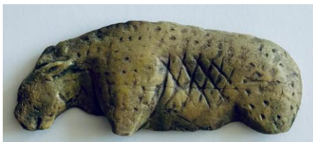
Höhlenlöwe aus dem Vogelherd, Im Original Elfenbein, 35.000 Jahre alt. Kopie Bild DEidG | Vergrößern