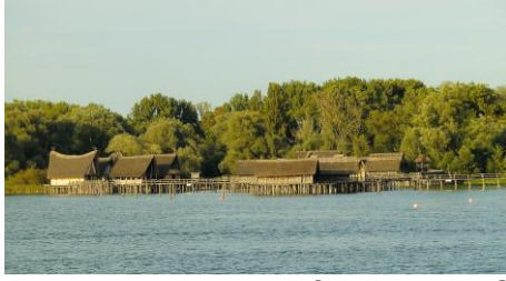
Rekonstruiertes Pfahlbaudorf Unteruhldingen am Bodensee