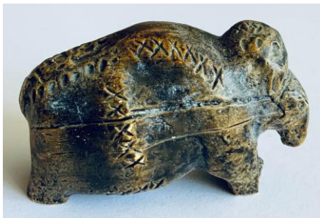
Mammut aus der Höhle Vogelherd, Schwäbische Alb (Kopie). Material des Originals: Elfenbein. Alter des Originals: 35.000 Jahre | Vergrößern

B Welche heutigen Meere bzw. Meeresteile waren komplett verschwunden?