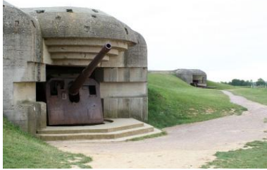
Deutsche Bunker des Atlantikwalls in Longues-sur-Mer Vergrößern