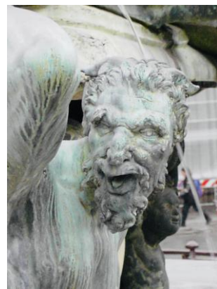
Giambologna: Satyr (Detail) | Vergrößern