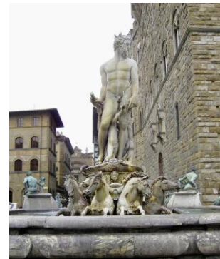
Ammanati: Neptun auf der Quadriga

Fassung vom 06.05.2026 Nach neuerer Fassung suchen