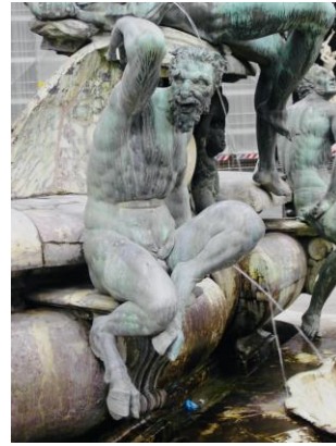
Giambologna: Satyr im Gefolge Neptuns Bild DEidG | Vergrößern