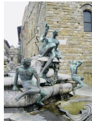
Giambologna: Gefolge Neptuns