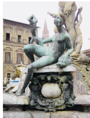
Giambologna: Nereide (Meeresnymphe) mit Muschel als Attribut im Gefolge Neptuns | Vergrößern