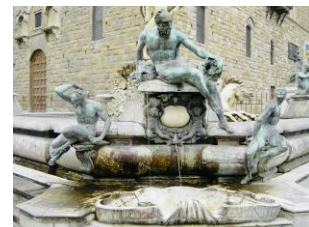
Giambologna: Meerestgottheiten im Gefolge Neptuns