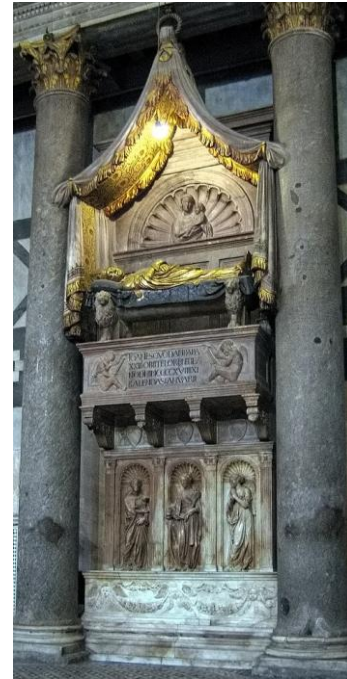
Grabmonument für Kardinal Cossa, ehemals Papst Johannes XXIII.

Papst Martin V. erhob Einspruch gegen die Nennung Cossas als Papst, aber ohne Erfolg.