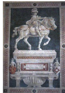
Andrea del Castagno: Reiterstandbild des Niccolò da Tolentino