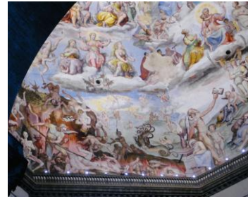
Kuppelgemälde von Giorgio Vasari und Federico Zuccari (1572 - 1579)

Vergleiche Michelangelos Jüngstes Gericht mit dem Vasaris / Zuccaris. Welches gefällt dir besser? Begründe. Lege deine Beurteilungskriterien offen.