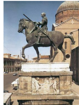
Donatello: Reiterdenkmal des Gattamelata in Padua, ca. 1445 - 1453