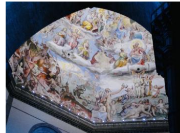
Kuppelgemälde von Giorgio Vasari und Federico Zuccari (1572 - 1579)