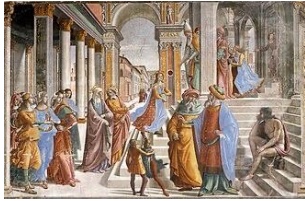
Gemeinfrei | Vergrößern