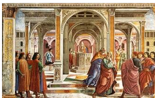
Gemeinfrei | Vergrößern