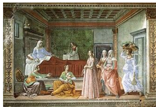
Gemeinfrei | Vergrößern