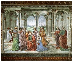
Gemeinfrei | Vergrößern