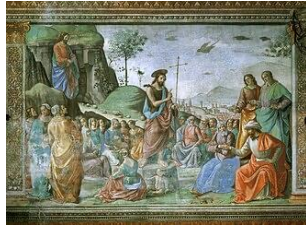
Gemeinfrei | Vergrößern