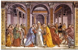
Gemeinfrei | Vergrößern