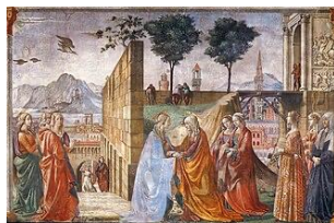
Gemeinfrei | Vergrößern