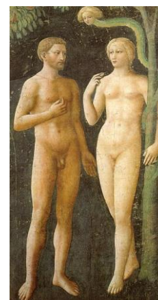
Masolino: Der Sündenfall Bild gemeinfrei | Vergrößern

Haltung (Füße nach unten), Eleganz der Gestik, Feinheit der Gesichtszüge , relativ flache Wiedergabe des Körpers stehen in gotischer Tradition.