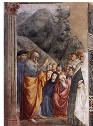
Masolino: Predigt des Petrus Bild gemeinfrei | Vergrößern

Predigt des Petrus (Masolino) Oberer Streifen Mitte mit Fenster, links