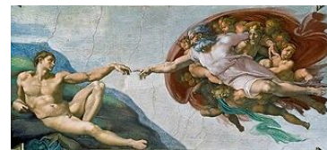
Michelangelo: Erschaffung Adams, Sixtinische Kapelle Bild gemeinfrei | Vergrößern

Gottvater aus Michelangelos Fresko "Erschaffung Adams" aus der Sixtinischen Kapelle in Rom ist nur ein Beispiel, das den Einfluss Masaccios auf Michelangelo Buonarroti zeigt. Diese Figur ist eindeutig von der Jüngerfigur ganz links in der Zentralgruppe aus der "Tempelsteuer" Masaccios inspiriert. Auch die Farben Masaccios kehren in der Renaissancemalerei häufig wieder.