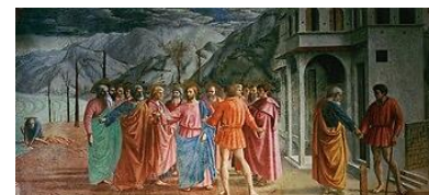
Masaccio: Zinsgroschen Bild gemeinfrei |