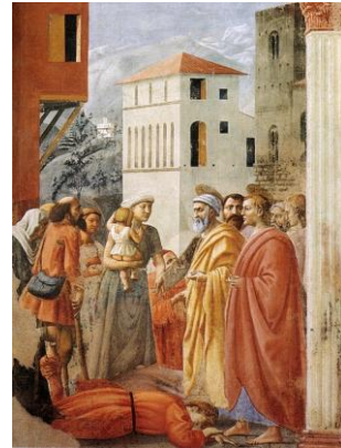
Verteilung der Güter in der Gemeinschaft. Tod des Ananias (Masaccio)

Bis dahin noch nicht dagewesen in der Kunstgeschichte sind Gestalten wie der naturgetreu wiedergegebene Krüppel mit seiner Krücke und der Prothese oder auch das Kindchen in Rückansicht, dessen Hinterteil durch das Elgengewicht auf dem Arm der Mutter flachgedrückt wird. Die Gesichter der Personen drücken eindeutig ihre Gefühle aus; der Betrachter wird durch den zwischen Petrus und Johannes aus dem Bild Herausschauenden in die Szene unaufdringlich mit einbezogen.