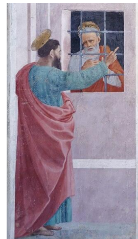
Paulus besucht Petrus im Gefängnis (Filippino Lippi)