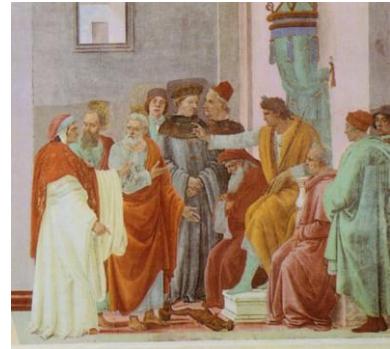
Disput rechts Bild gemeinfrei | Vergrößern

Disput mit Simon dem Magier vor dem grimmigen Kaiser Nero in Anwesenheit einiger Höflinge. Der Disput dreht sich um die am Boden liegende dunkle Figur, die wohl die "schwarze" (schwarze Magie!), dem Teufel ergebene, Seele des Magiers ist.