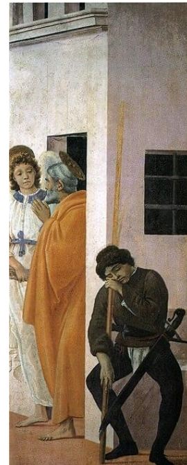
Befreiung Petri aus dem Gefängnis durch einen Engel (Filippino Lippi)

Befreiung Petri aus dem Gefängnis durch einen Engel (Filippino Lippi) Unterer Streifen Eingang