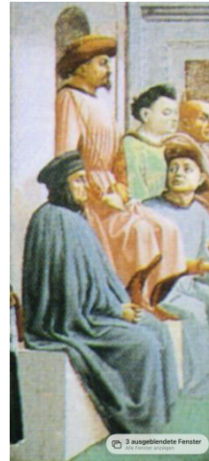
Gian Galeazzo Visconti? Coluccio Salutati Bild gemeinfrei | Keine Vergrößerung

Die vier Passanten am rechten Rand des Bildes seien v.l.n.r.