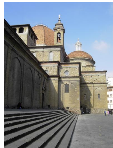
San Lorenzo von außen Bild DEidG | Vergrößern

Die Biblioteca Laurenziana, entworfen von Michelangelo, wird 1559–68 erbaut.