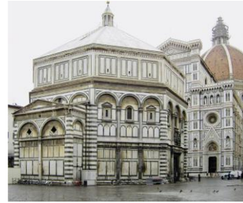
Baptisterium, Florenz, Protorenaissance Bild DEidG | Vergrößern

Die folgende Datei ist unter der Creative- Commons-Lizenz „Namensnennung – Weitergabe unter gleichen Bedingungen 3.0 nicht portiert“ lizenziert Namensnennung: I. Sailko