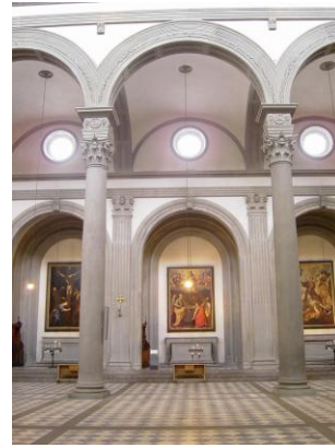
Blick vom Hauptschiff in die Seitenskapellen Bild DEidG | Vergrößern

Durch die Betonung der Horizontalen entsteht ein Tiefenzug in die Chorkapelle, der von Brunelleschi, dem Erfinder der Zentralperspektive, gewollt ist und