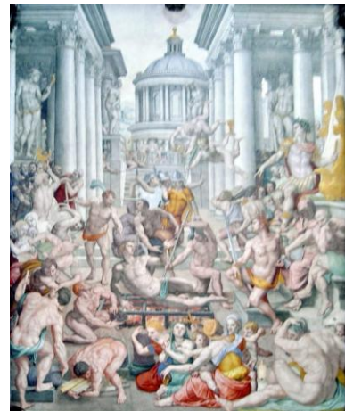
Bronzino: Martyrium des Hl. Lorenz

Nicht realisiert wurde ein Entwurf Brunelleschis für einen Palast Cosimos, weil Cosimo den Neid der Mitbürger fürchtete.