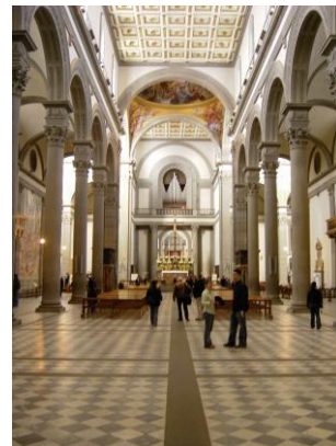
San Lorenzo. Blick vom Hauptschiff in die Chorkapelle Bild DEidG | Vergrößern