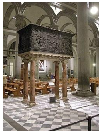
Kanzel Donatellos mit Passionsszenen. Bronze