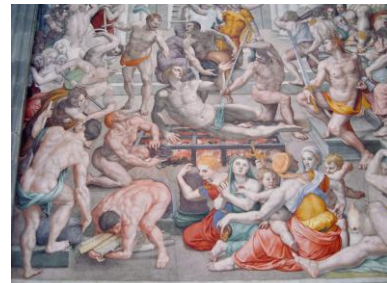
Bronzino: Martyrium des Hl. Lorenz, Ausschnitt