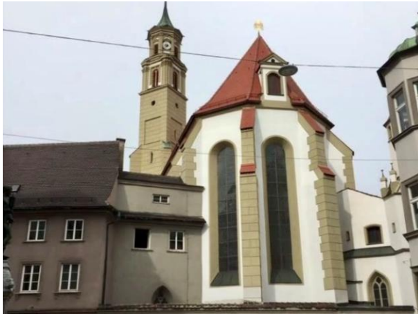
St.-Anna-Kirche Augsburg mit Fuggerkapelle und Lutherstiege