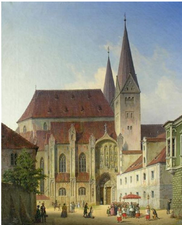
Augsburger Dom von Norden mit dem gotischen Hochchor und den romanischen Türmen. Bild von 1844