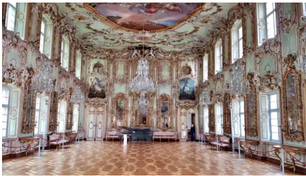
Rokokofestsaal im Schätzlerpalais