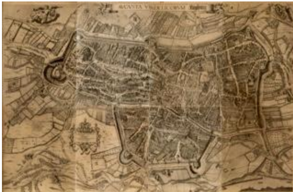
Wolfgang Kilian: Augsburg 1626 mit allen damaligen Gebäuden