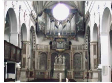
Fuggerkapelle Demnächst schärferes Bild

Außen epitaphien hinter dem Altar (links Ulrich Fugger, rechts Georg Fugger) nach Zeichnungen Dürers