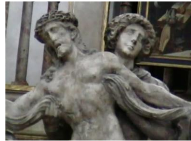
Erbärmdegruppe: Detail Schärferes Bild demnächst. Vergrößern

Die Kugeln der Putten gehören zur Göttin Fama, symbolisieren also den Ruhm der Fugger (Gedächtniskapelle)