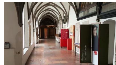
Kreuzgang von St. Anna mit Eingang zum Museum Lutherstiege