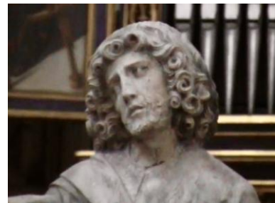
Erbärmdegruppe: Detail Schärferes Bild demnächst. Vergrößern

Du kannst mit Hilfe des Kontaktformulars auf der Startseite Fragen zu den Aufgaben stellen.