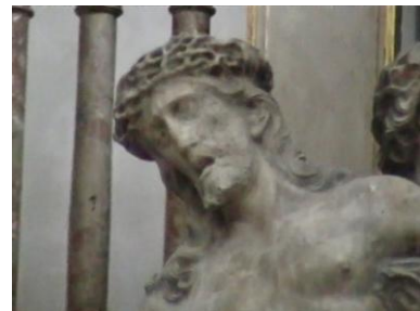
Erbärmdegruppe: Detail Schärferes Bild demnächst. Bild: DEidG | Vergrößern