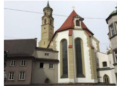
Ev.- lutherische Pfarrkirche St. Anna.

Fassung vom 05.07.2026 Nach neuerer Fassung suchen