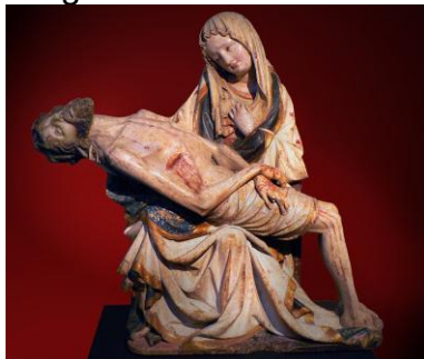
Krakauer Pietà Bild gemeinfrei / Vergrößern

Die Kugeln der Putten gehören zur Göttin Fama, symbolisieren also den Ruhm der Fugger (Gedächtniskapelle)